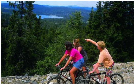
Er man træt af vabler på fødderne, er cyklen et fint transportmiddel til afveksling

ter prøvede vi heldet igen. Denne gang fra Danebus lille robåd på søen tæt ved. Heldigvis havde vi både madkurv, medbragt snaps med fra hjemlandet samt regntøj. Efter en time åbnede den norske himmel for sluserne med iskold sommerregn. Men det var hele umagen værd igen at sidde i pejsestuen med tørre træningsdragter og dyngvåde joggingsko. De medbragte portugisiske forsyninger måtte vi nøjes med at glæde os til på værelset. For nok drikker nordmændene, men mest vand og sodavand. En flaske vin til seks menneskers middag er ikke hverdagsluksus oppe på de kanter.