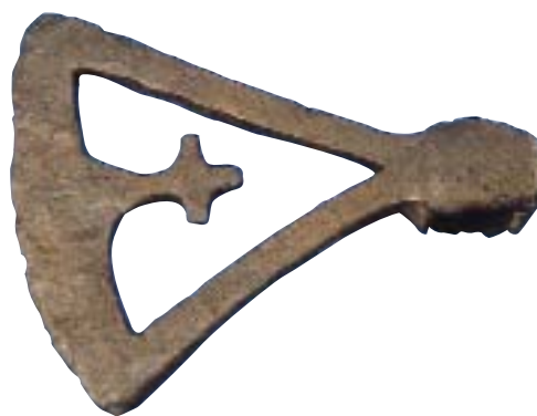
Øksehoved med kors, fundet på Lolland

"De onde, de gode og dem fra Lolland", siger man. Foreningen NORDEN i Holstebro arrangerer en forårstur til Lolland. En kulturel, natur-, historisk og sangbar tur. "Jamen der stinker jo af roer!" Ja, der er i hvert fald mange af dem. Når man fortæller jyder, at man er fra Lolland, lyder svaret som regel: "Der har jeg nu aldrig været".