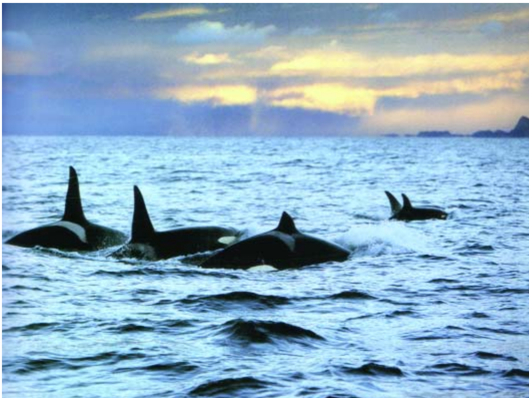
Illustration fra "Til nordisk nytte"

Vi kalder turen for Saga 2. Vi har i tre år rejst Vestisland tyndt, nu gælder det nord og øst.