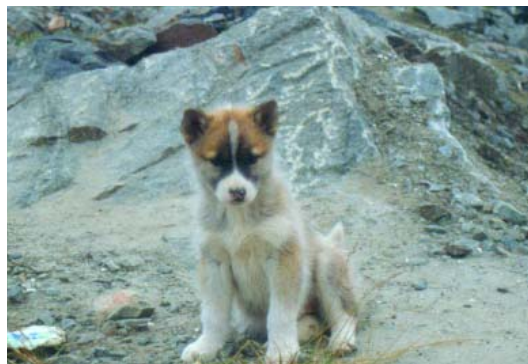
En lille ny hvalp, der snart skal starte livet som slædehund.

Den samme ekspertise, som det kræver at fremstille brugbart fangerudstyr, fordrer det at træne hundene, hvis de skal bidrage til en vellykket jagt. Man starter da også tidligt med hvalpene. "En hund, som tidligere har løbet i spand, og som får et kuld hvalpe, kom-