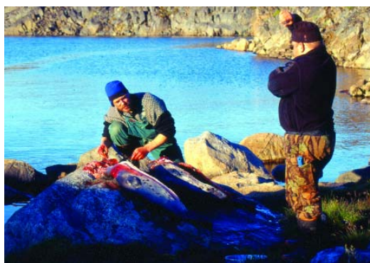
En stor del af fangernes arbejde går med at skaffe mad til hundene