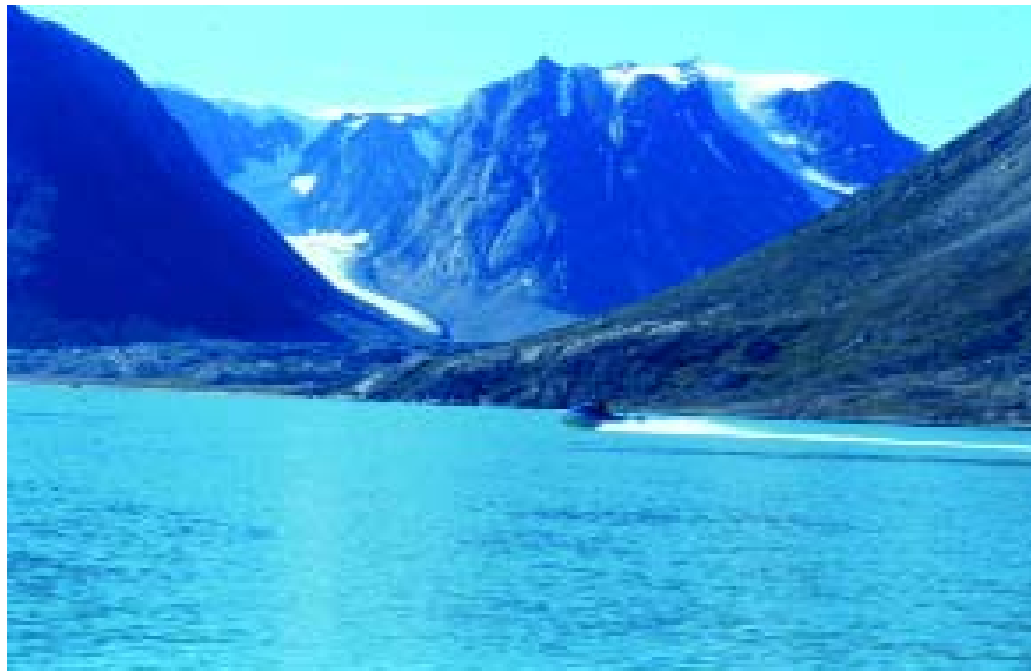
Kangerlussuaq/Søndre Strømfjord - hovedindfaldsporten til Grønland