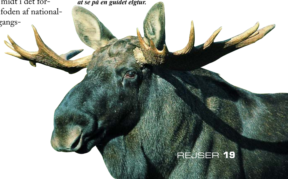
Elgen – kan man være heldig at se på en guidet elgtur.

Her skulle vi omsider komme på nært hold af elgen, der hidtil havde snydt os. Den lå der i udkanten af pladsen, stor, tung, ubevægelig og grå. "Hold jer lige lidt på afstand" sagde en herre i samisk udstyr, da vi kækt styrede imod vilddyret. Så vi nøjedes med pænt at fotografere den på afstand. To norske småpiger havde dog helt anderledes håndfaste planer, som det ikke lykkedes os at snakke dem fra. "Jamen, den gør ikke noget! Se selv, det er bare en gammel ren, måske er den død". Og sådan er ingenting, som man tror, det er, når man tager på fjeldet om sommeren. Men vi er klar igen til vinter. ■