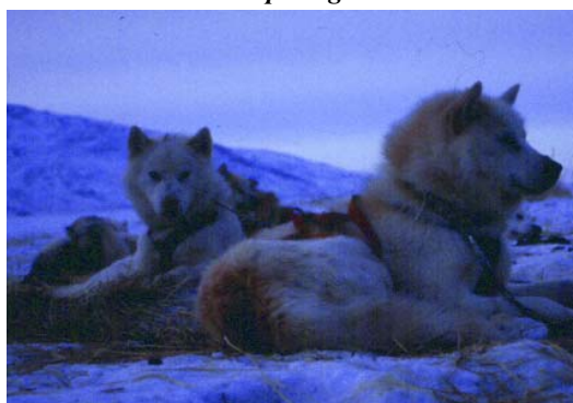
Slædehunde – om vinteren trækdyr, om sommeren undertiden anbragt på en øde ø, hvor de bliver fodret to gange om dagen